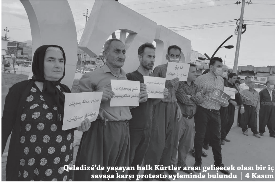
Qeladizê'de yaşayan halk Kürtler arası gelececek olası bir iç savaşa karşı protesto eyleminde bulundu | 4 Kasım

I. Emperyalist Paylaşım Savaşı'ndan sonra dört parçaya bölünen -bölgesel 4 gerici, faşist devlet arasında paylaştırılan-Kürtler, bu yönetimlerle barışık olmamış, sürekli mücadele içerisinde olagelmışlerdir.