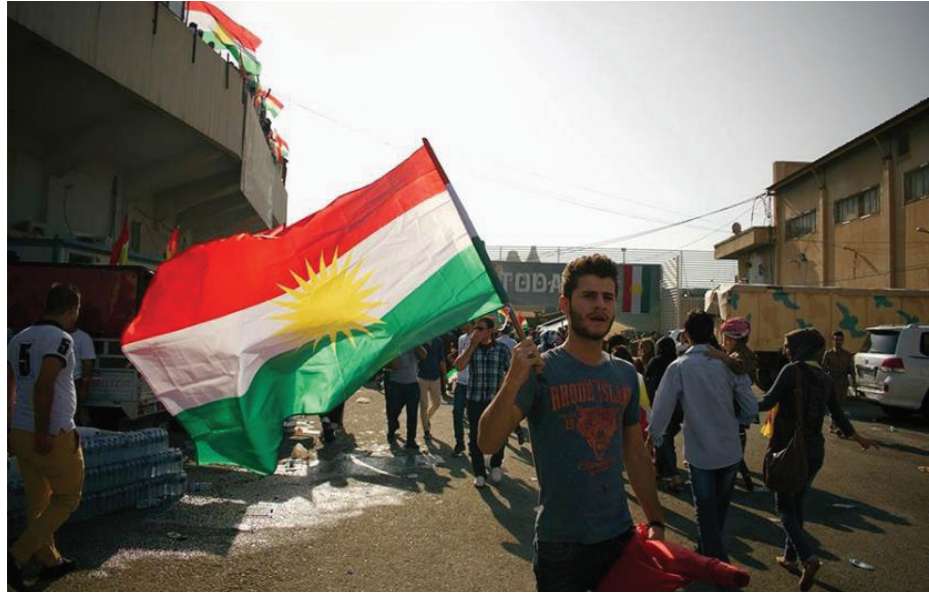
Mevcut durumu Rojava ve Güney Kürdistan arasındaki bağlantıyı kesme hedefli bir operasyon olarak nitelendirmek çokta yanlış olmayacaktır.

yönünü bir nebze de olsa Şengal'e çevirmekten vazgeçmiş görünüyor. Medya Savunma Alanları'na dönük hamlelerini devreye sokmuş olmasından bu çıkarımı yapabiliriz. Tabi bazı değerlendirmeler hem Şengal hem de Gare'ye dönük saldırıların eş zamanlı yürütülebileceği yönünde.