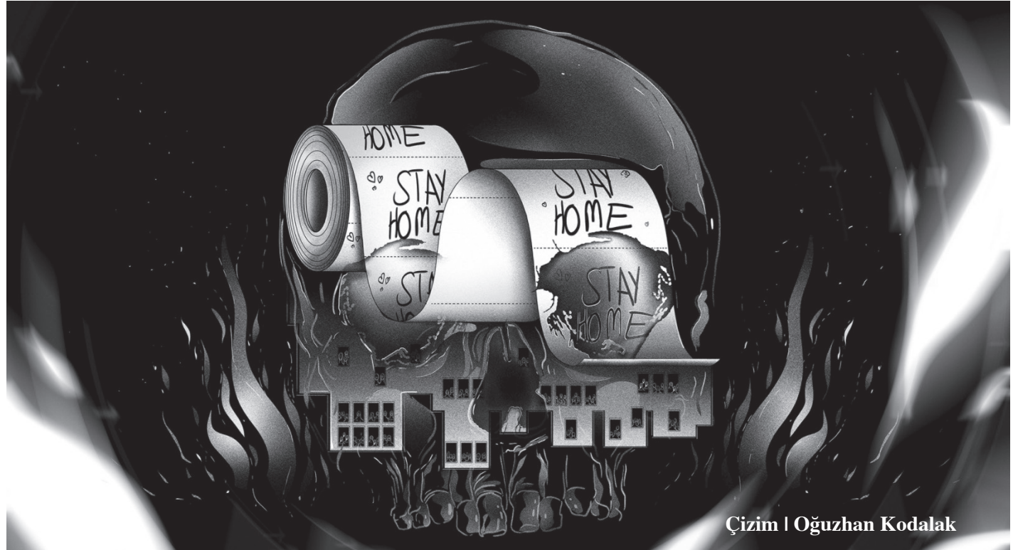
Çizim | Oğuzhan Kodalak

Örneğin online ticaret ağı üzerinden satış işlemi yapan ABD orijinli Amazon tekeli, bu sürecin en çok